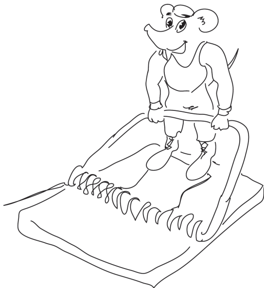
Особо талантливая мышшь.